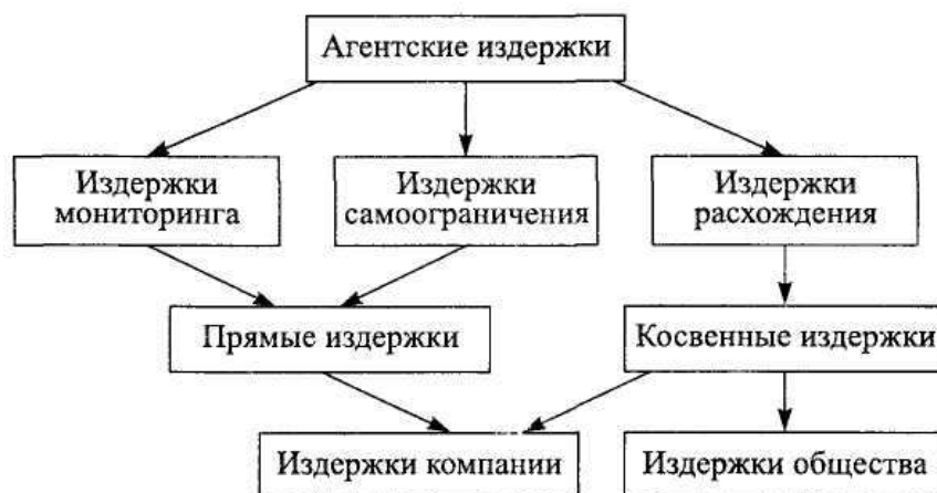
Рис. 1. Классификация агентских издержек

торыми отличиями: «Помимо затрат, имеющих стоимостную оценку, издержки включают также и негативные последствия, стоимостная оценка которых может отсутствовать вообще либо быть исключительно субъективной». Как видно из классификации, термин «издержки» в полной мере отражает суть агентских потерь (рис. 1).