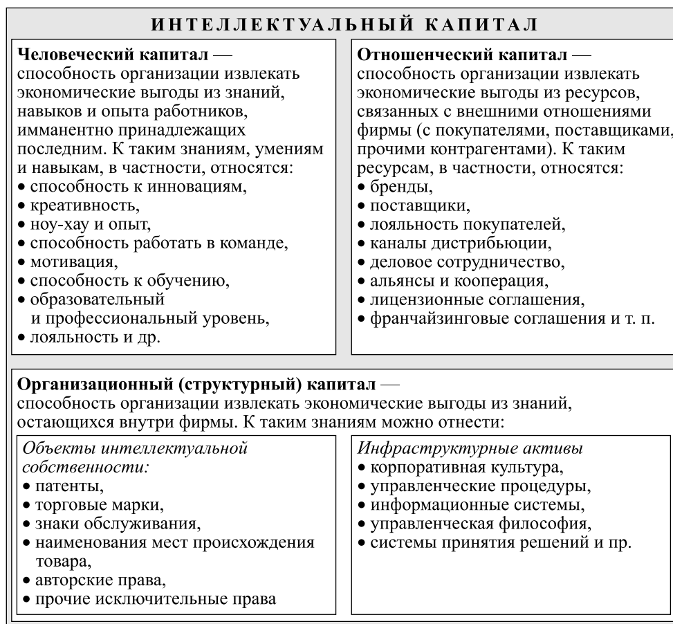
Рис. 2. Структура интеллектуального капитала

На наш взгляд, состав и структура нематериальных активов во многом определяются классификацией нематериальных активов, разработанной Международной бухгалтерской федерацией ( International Federation of Accountants ) [IFAC, 1998]. Представляется, что в структуре нематериальных активов можно выделить три блока: человеческий, отношенческий и структурный (организационный) капитал (рис. 2).